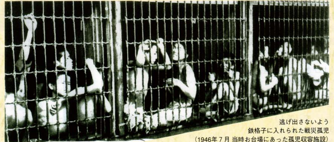
逃げ出さないよう 鉄格子に入れられた戦災孤児 (1946年7月 当時お台場にあった孤児収容施設)