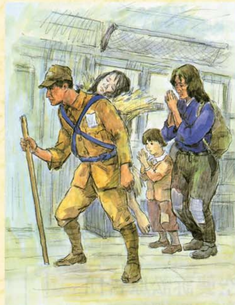
省線遺体 狩野光男・絵

遺体を背負って省線(山手線)に乗り込んできた人。遺体を置いておくと処分されてしまうので、遺体を持ち歩いていたようだ。